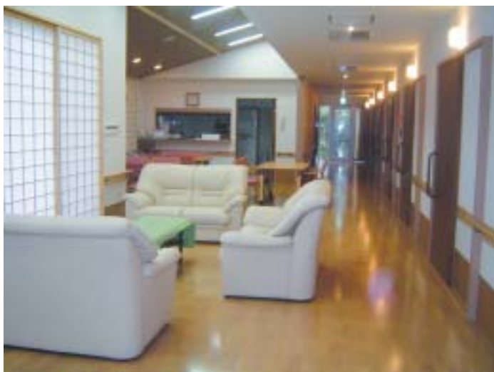
食堂・デイルーム